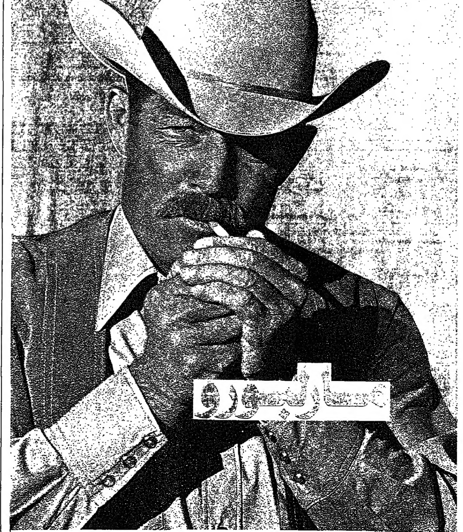
مستورة مباشرة من الولايات المتحدة وموزعة في لبنان من قتل الإرادة اللبنانية لحصر الشيخ والتشريف وزارة الصحة العامة تحذركم من تضارر التضخيم

ناتي من اقليم النجاش الجريح نتيجة حرب عنيفة دموية بين اخوة السلاح، ناتي اليكم ونحن نحمل معنا هموم وعذابات اهنا في الاقليم من جراء هذه الحرب. هذه الحرب التي ادت الى قتل وتشريد وتهجير وتدمير هذه الحرب التي نرفض منطلق ادلائها ومنطق استمرارها، هذه الحرب التي تقدم عبرنا خدمة مباشرة واكيدة للعدو الصهيوني. ونحن نكثج علينا لاهالي اقليم النجاش حولنا جاهدين لمنع اشراخ هذه الحرب عما تحول الان ايضاً ترها. استقبل الرئيس الياس الهراوي ظهر اسس الرئيس عادل عسيران مع وفد من اللجنة العليا لاهالي اقليم النجاش، وجرى عرض الوضع في المنطقة خصوصاً لجهة تنفيذ قرار حكومة الحص بتسليم الجيش مهام الامن في اقليم النجاش. وخلال اللقاء الذي حضره اللجنة العليا لاهالي اقليم النجاش السيد شوقي عسيران كلمة جاء فيها: فخامة الرئيس، ناتي اليكم من اقليم النجاش بعد تهجير قسري قارب العشرة اشهر ولا ينه بعد.